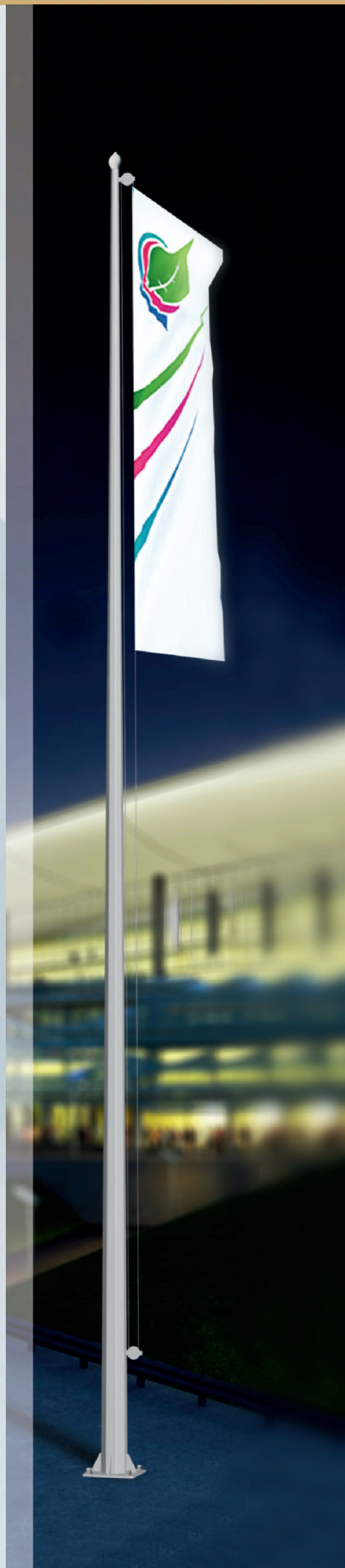
ТАБЛИЦА ХАРАКТЕРИСТИК Ф2ак (ГРАНЕНЬИ)