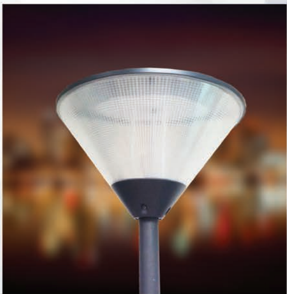
СВЕТИЛЬНИК УЛИЧНЫЙ ЖТУ08/ГТУ08/ДТУ08 NEO ТУ ВУ 191039087-2010